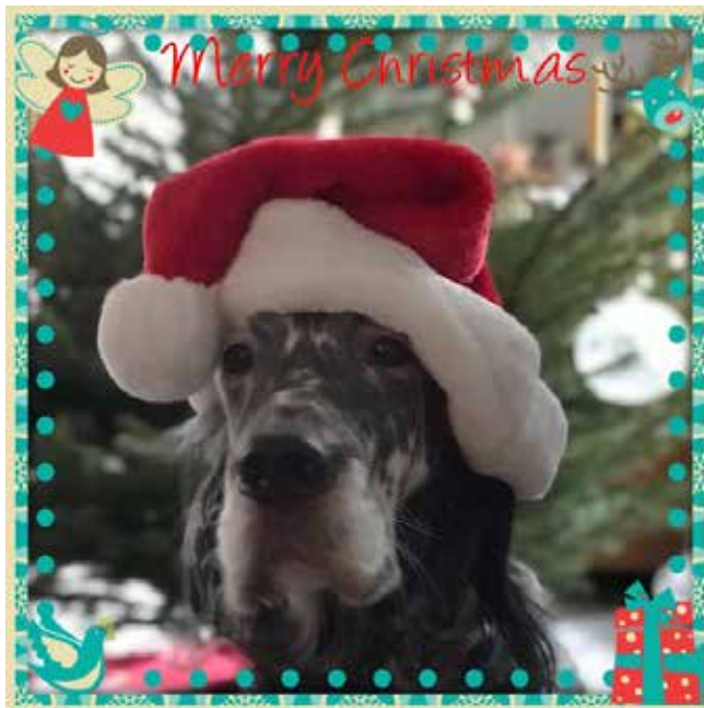
Karte: Ellen Minder