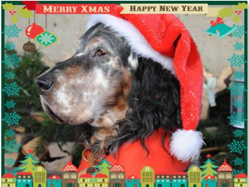
Karte: Ellen Minder