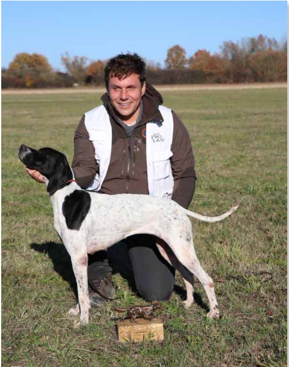
Milky Way De L'escalayole