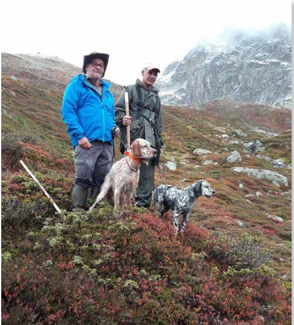
Sun del Zagnis, Ari dei Galli Forcelli