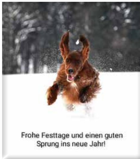
Karte: St. Galindo