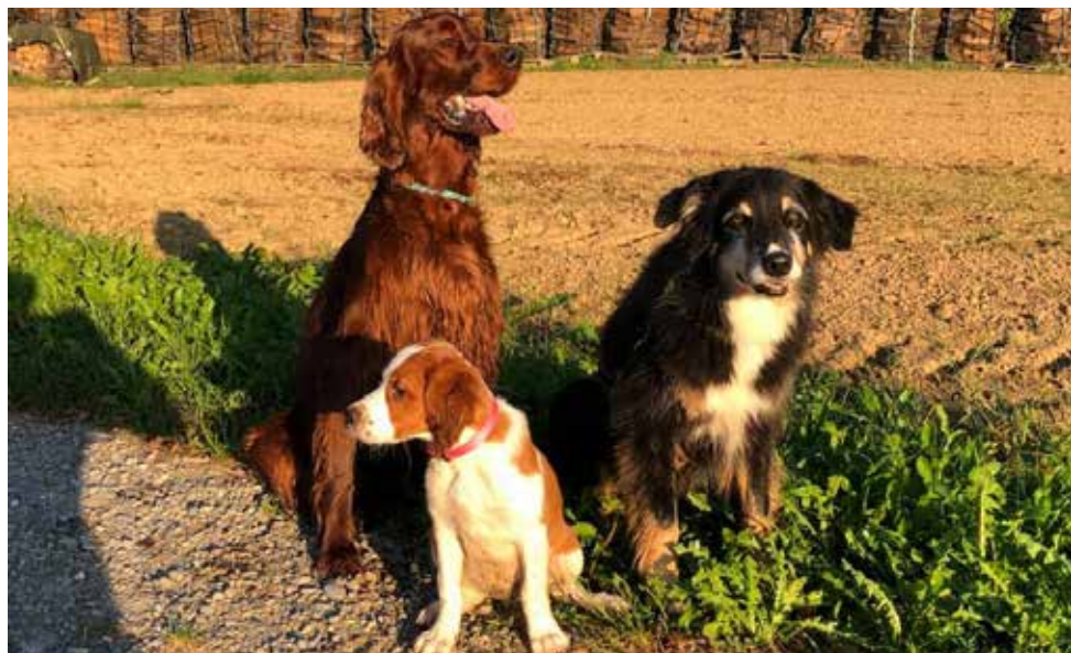
Vistador Down the Stars „Ben“, Spike und Vistador Fiery Silver Orchid „Vaiana“