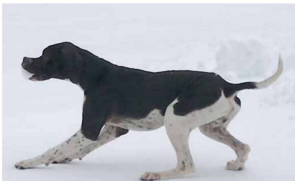
Porsche del Galazzo di Patrizio Biotti